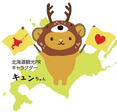
北海道観光PR キャラクター キュンちゃん