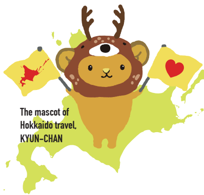
The mascot of Hokkaido travel, KYUN-CHAN